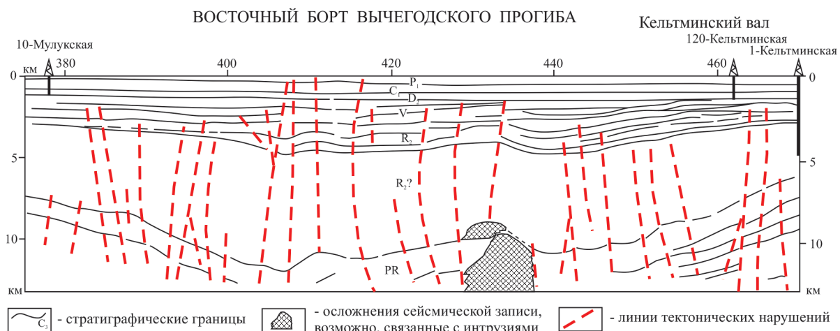
Рис. 1. Сейсмогеологический разрез по профилю 26А-РС (Вахнин, 2016)

Потенциальная доманиковая нефтяная система Вычегодского прогиба доминирует в восточных районах и является периферийным фрагментом региональной нефтяной системы, охватывающей территории Волго-Уральской и Тимано-Печорской нефтегазоносных провинций (Lindquist, 1999; Klimenko, 2011; Timothy, Michael,