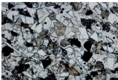
Рис. 4. Песчаник мелкозернистый аркозовый с базально-поровым равномерным карбонатным цементом. Вид – при скрещенных николях, увеличение 100X, обр. 15620-08, инт. инт. 2073-2080, место взятия 1,58 м, Малохетская свита, пласт Мх-III, скв. Тгл-4, биотит на ранней стадии аморфизации.

перехода от катагенеза к метагенезу и от последнего к метаморфизму. Начальный бластез обломочного кварца свидетельствует о начале метагенеза, а появление полнобластических структур – о переходе к региональному началу метаморфизму.