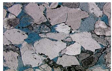
Рис. 2. Фото шлифа № 15485-08. Вид – при скрещенных николях, увеличение 100X, интервал отбора 2050,0-2060,0 м, место взятия 1,87 м. Малохетская свита, пласт Мх-III, скв. Тгл-4.

- По минералогическому составу исследованные породы – полевошпатово-кварцевые.