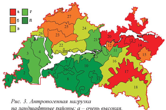
Рис. 3. Антропогенная нагрузка на ландшафтные районы: а – очень высокая, б – высокая, в – средняя, г – низкая, д – очень низкая.