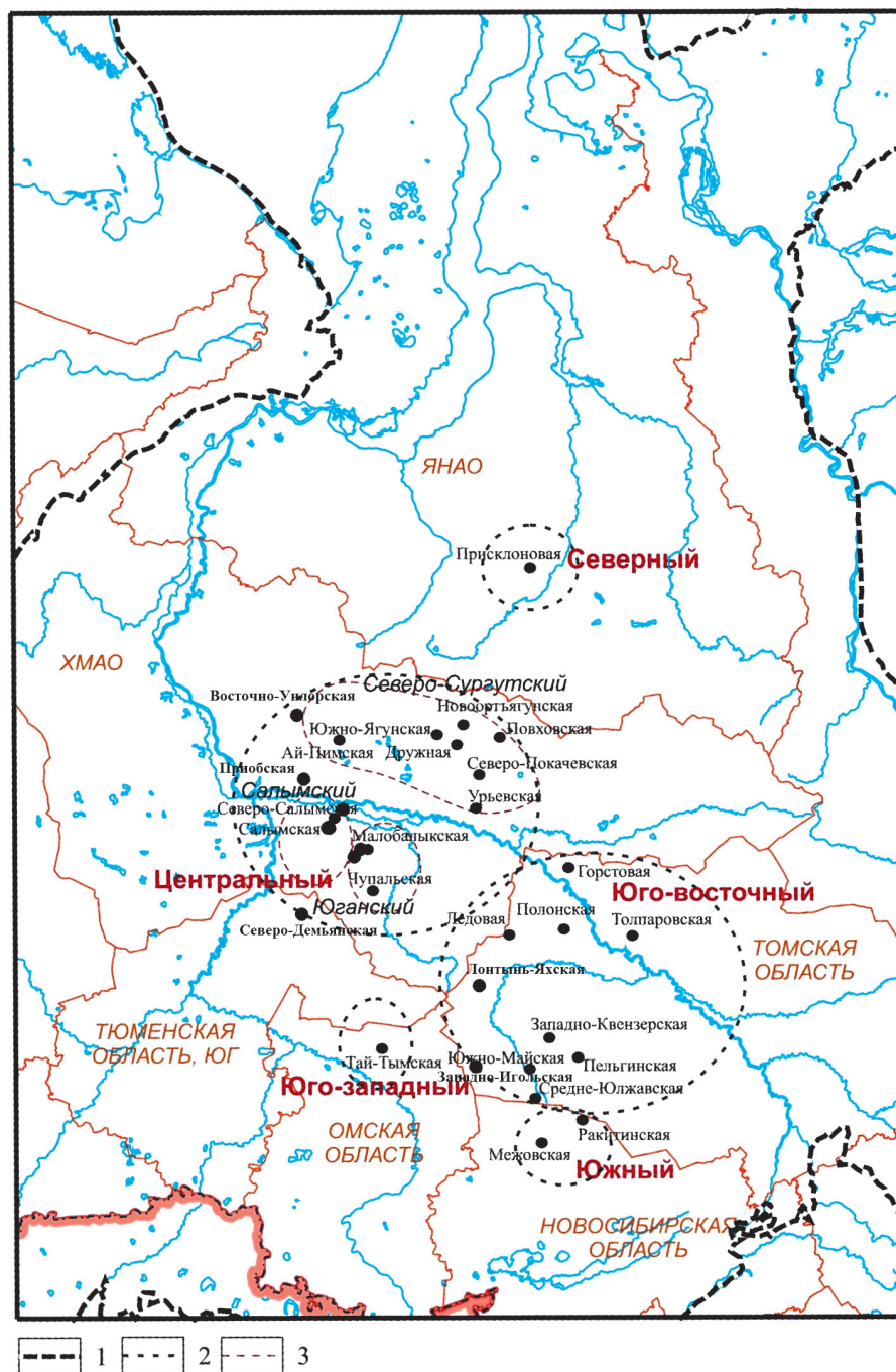
Рис. 1. Схема расположения изученных разрезов баженовской свиты. 1-3 – границы выклинивания мезозоя (1), изучаемых районов (2), подрайонов (3).